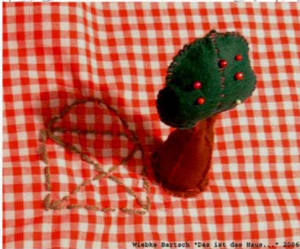
Wiebke Bartsch "Das ist das Haus..." 2006